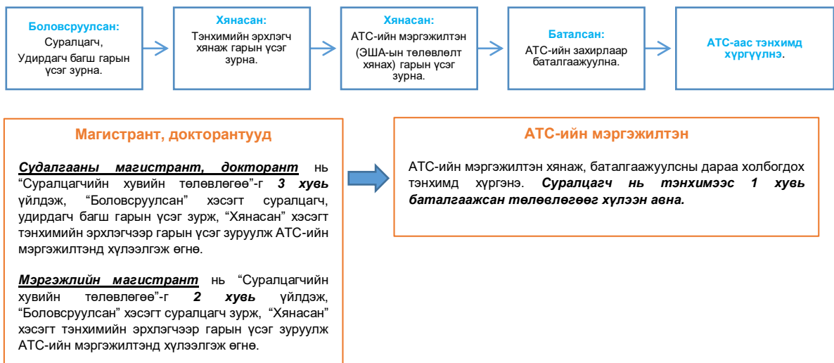
Зураг 7. Суралцагчийн хувийн төлөвлөгөөг хянах, баталгаажуулах